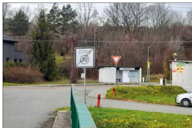
...v roce 2022