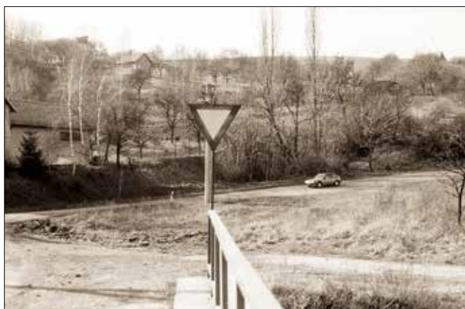
Původní trasa silnice II/438 před jejím narovnááním (1989)