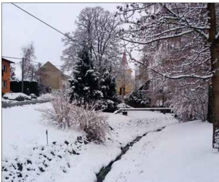
První sněh letošní zimy - 10. 12. 2021