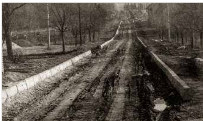
Příprava nové místní komunikace za OÚ (1974)