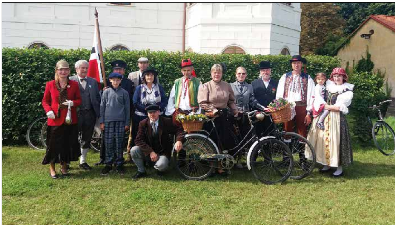
Naše obec měla mezi účastníky dožíněk početné zastoupení