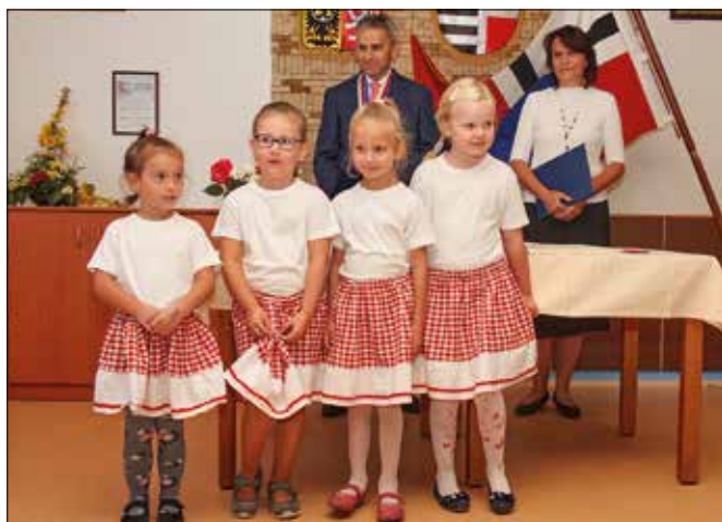
Úvodní vystoupení dětí z MŠ Dobrotice