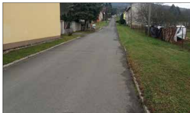
... v roce 2021