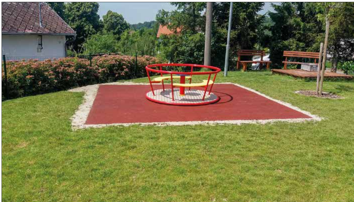
Na dětském hřišti byla instalována v červenci dopadová plocha a kolotoč tak děti mohou využívat i při deštivějším počasí