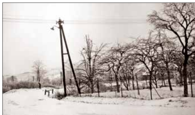
Původní cesta v Souhradech před č. 73 (šedesátá léta)