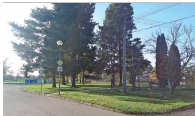
... v roce 2020