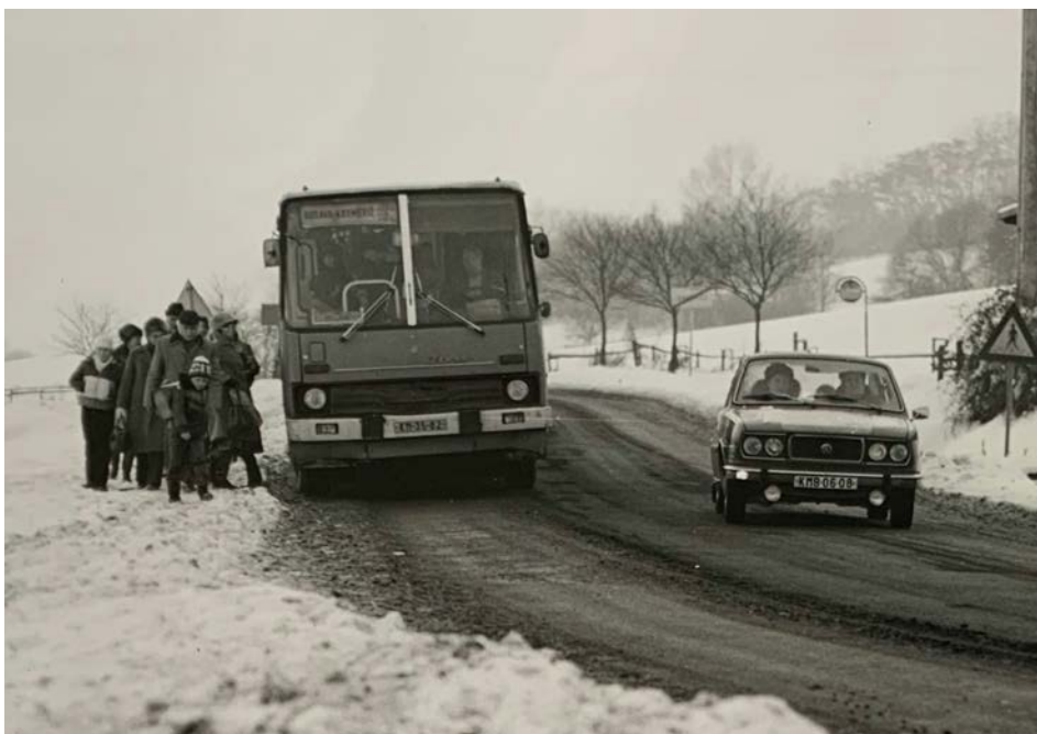
Příchod občanů od zastávky do obce.

Mé zamýšlení nesměřuje k nějaké agitační jak získat dobrovolníky pro práci nebo finanční podporu pro další rozvoj obce.