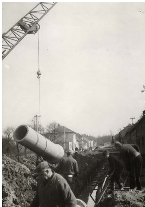
V roce 1971 se v obci budovala kanalizace.