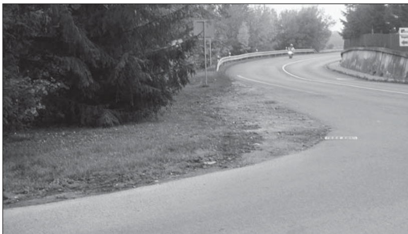
... v roce 2017