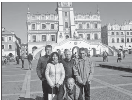
Na náměstí v Zamošči