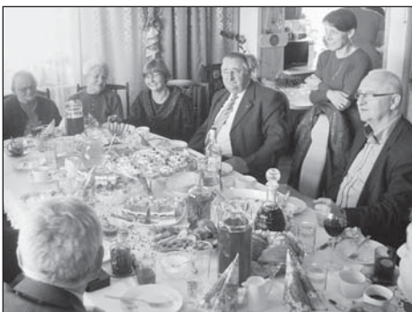
V Sitnu jsme byli přijati také v rodinách potomků

O dalším vývoji spolupráce s polskou stranou a také programu jejich červnové návštěvy vás budeme průběžně informovat na stránkách obce.