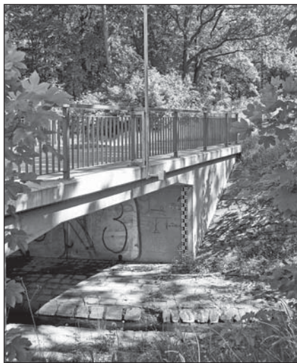
Na mostě do Chomýže je nainstalována ultrazvuková sonda a vodočetná lať

Ve výběrovém řízení na zhotovitele byla vybrána firma Empemont, s.r.o., Valašské Meziříčí, digitální povodňový plán zpracovala společnost Envipartner Brno. Realizace proběhla od ledna do března 2017. Na začátku února, v době, kdy se jednotlivé