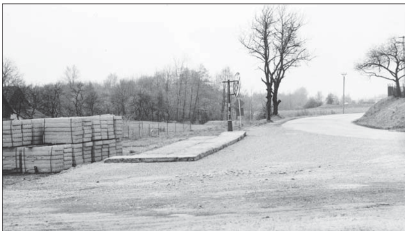
Stará silnice a autobusová zastávka ve směru do Bystřice p/H – 27. 4. 1985