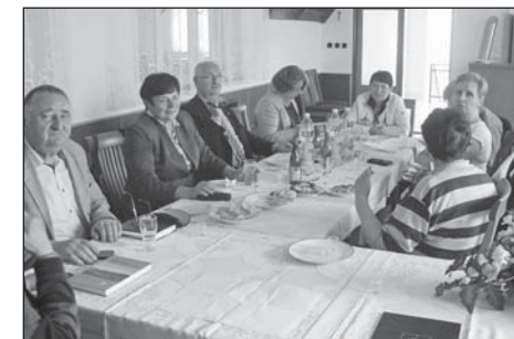
Květnová návštěva v Jankovicích

Došlo i na diskusí představitelů obcí o možnostech budoucí spolupráce v oblasti cestovního ruchu, zemědělství nebo výměny zkušeností. Zároveň jsme pozvali vedení obce