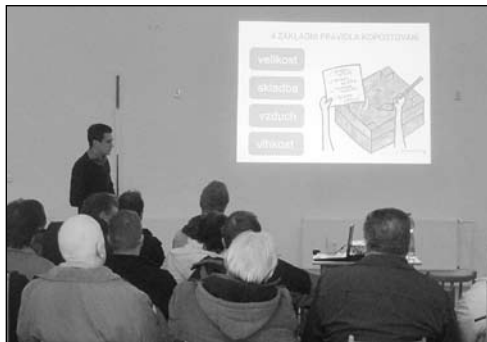
Březnová prezentace pro občany o způsobech kompostování

Od února 2016 má obec k dispozici také vlastní traktor Zetor 7745, který byl drobně upraven v souladu pro provoz s traktorovým nosičem. Nově si také bude již tuto zimu obec zajišťovat vlastními silami zimní údržbu místních komunikací. Pouze posyp drtí zatím zůstává ještě nasmlouván u Technických služeb Holešov.