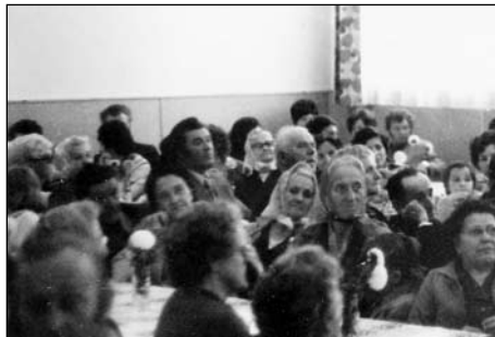
Pohled do sálu na přítomné občany

Po projevech následovala společná večeře - srnčí guláš. Srnce věnovalo MS Lipina Jankovice.