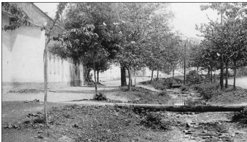
Potok Zhrta v roce 1954 před regulací – pohled od čísla 33