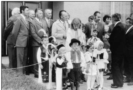
Otevření budovy MNV - 4. 9. 1976, recitace děti z MŠ