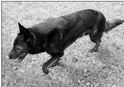
O tohoto psa, kterého se někdo zbavil, se musela obec na vlastní náklady postarat, než jsme pro něho našli nového majitele

Je v zájmu obce, aby se po veřejných prostranstvích bezprizorně nepotulovala žádná zvířata, aby neobtěžovala okolí a kolemjdoucí, aby neznečistovala svými exkrementy chodníky a hlavně aby nikoho neohrožovala.