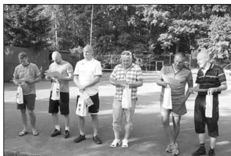
Setkání vítězů z předchozích let se uskutečnilo 25. 6. 2016