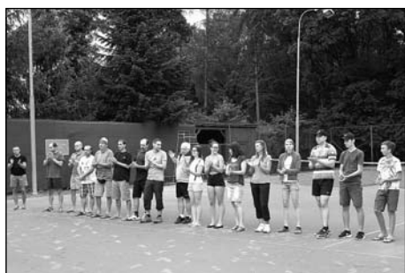
Vyhlášení nejlepších ze všech kategorií proběhlo po skončení finále dvouhry mužů v pátek 8. 7. 2016