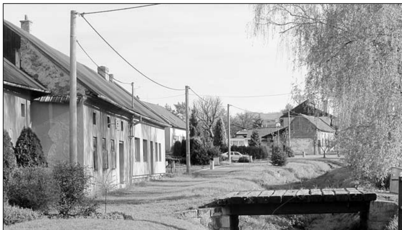
... v roce 2016