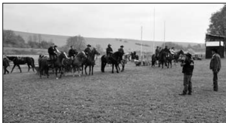
Zahájení Hubertovy jízdy 2. 11. 2013