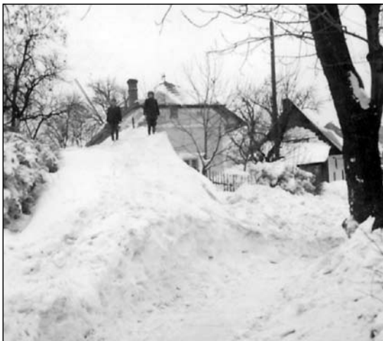
Závěje na Pohoršově

Podle jejich vzpomínek sníh napadl už před Vánocemi a doprovázely ho velké mrazy, až kolem 38 stupňů. Zima pak trvala dlouho a nejhorší na ní byly mrazy a obrovské množství sněhu. Přišla i sněhová vánice od severu, která nafoukala ohromné závěje. Sněhu leželo tolik, že na Pohoršově u Lipnerového dosahoval až po střechu. Stromy praskaly, hlavně všechny třešně u silnice, a potom uschly a už nerodily. A jak se lidé z Jankovic dostali z vesnice? Jezdilo se třeba na saních nebo na lyžích.