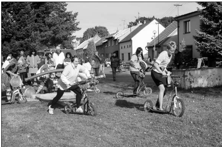
Závěr sportovní sezóny v Jankovicích 5. 10. 2013

Po slavnostním nástupu se jednotlivá družstva pustila do plnění úkolů. Po dlouhých patnácti letech se objevila na startu zcela nová sestava žen SDH Jankovice. Požární útok se jim běžecy povedl dobře, ale technický problém ve druhém kole nastal při shazování terče na levém proudu, a tak nakonec obsadily druhé místo za SDH Brusné. Kategorie mužů se nesla oproti zvyklostem zcela v jiném průběhu a měla také jiné pořadí.