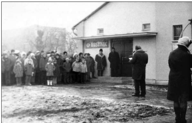
Shromáždění občané před otevřením 13. 1. 1973

Hostů a návštěvníků přibývalo, neboť od 16. hodiny bylo pohostinství otevřeno veřejnosti. Večer podáván srnčí guláš všem přítomným. Srnce věnovalo Myslivecké sdružení k ukončení akce stavby. Veselí, zpěv, radost, uspokojení z vykonaného díla bylo znát na tvářích všech.“