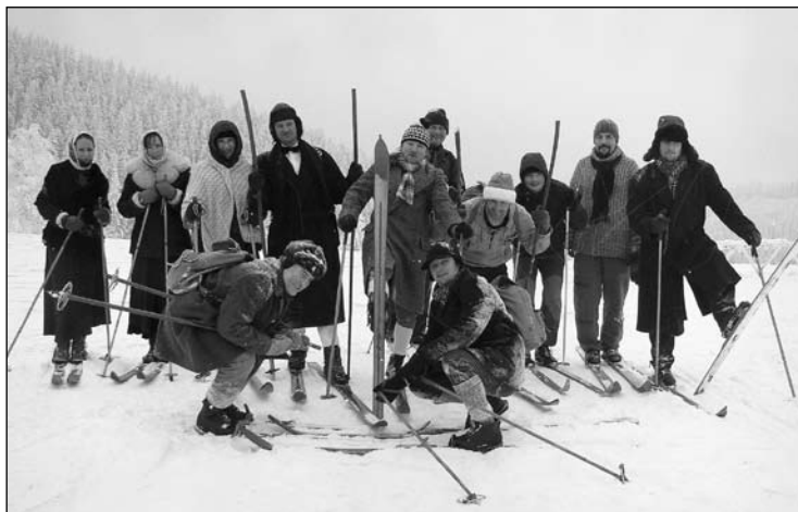
19. 1. 2013 Vyjíždka na starých lyžích

pozn.aut.- této akce se účastním pouze jako pozorovatel z domu