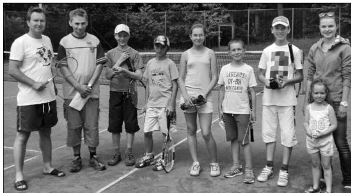
Z vyhlášení výsledků turnaje mládeže 29. 6. 2013

Červen se stává pro řadu tenisových nadšenců z okolí časem, kdy přijíždějí změřit síly s ostatními na turnaj do Jankovic. Očekávaná podívaná proběhla ve sportovním areálu posedmadvacáté v rámci dvouher a ve čtyřhrách se tento rok hrál šestnáctý ročník. Od pátku 14. června byly nejprve rozehrány základní skupiny dvouher mužů a ostatní kategorie byly průběžně také raženy do nabitého programu zápasů.