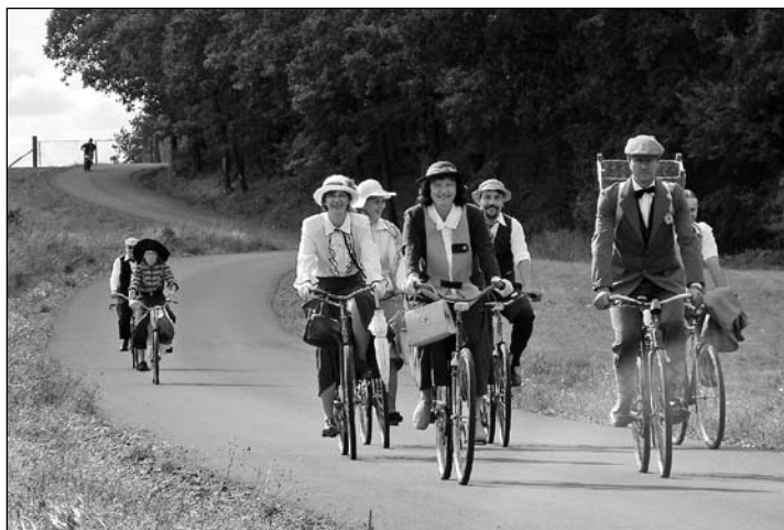
Na starých kolech a v dobových oblecích