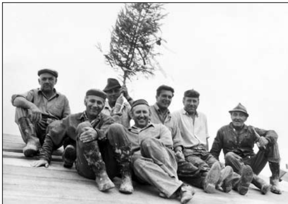
Střecha hospody dokončena

„Je sobota, 13. ledna 1973. Mráz -6° C, všude jiskří jinovatka, protože sněhu není. Rozhlas vyhrává a zve občany k účasti na slavnostní otevření prodejny Jednoty. A občané se scházejí, zvláště početně je zastoupena mládež, neboť hlavně jim bude toto vybudované dílo sloužit. Účast občanů roste a úměrně vzrůstá i slavnostní nálada na tvářích účastníků, ale i těch, kteří budou zanedlouho spolupůsobit při slavnostním otvírání prodejny. Československá vlajka se na stožáru mírně vlní, jako uspokojení nad dobrým dílem. Do hovoru občanů náhle zazní řízný pochod „Kolíne, Kolíne...“ místní kapely „Broučků“. Nálada roste a přicházejí noví a noví občané, hnání spíše zvědavostí.