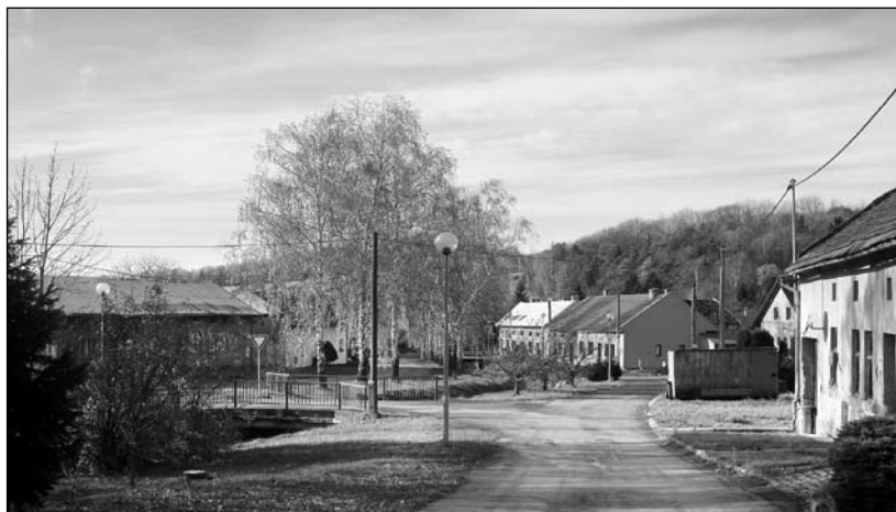
... v roce 2013