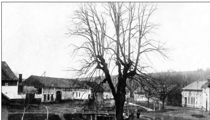
Stará lípa pod zvonící (skácena byla podle údajů v kronice v roce 1942)