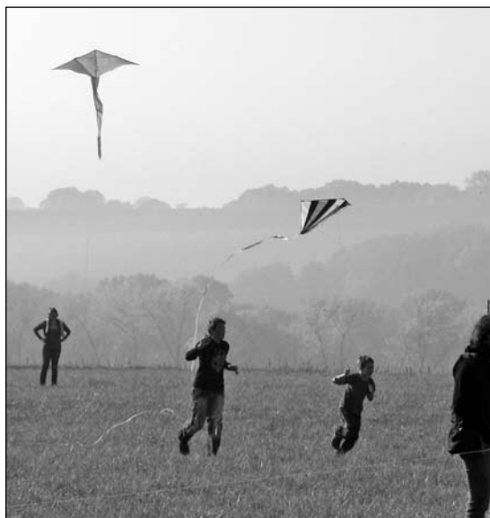
Pouštění draků Na Vinici