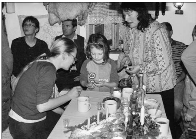
16. 12. 2012 Adventní neděle v muzeu

V předvánočním čase se také scházíme, a to v „muzeu“ u kamen. V loňském roce jsme však zahájili adventní odpoledne vycházkou do lesa. Každý vzal něco dobrého a vhodného do krmelců pro zvířátka. Šli jsme kolem kříže do Březí, přes Hůrky, k železnáku a do muzea. Tam už bylo teplo od kamen. Voněl šípkový čaj, vanilkové rohlíčky, perníčky, linecké... Nechyběla ani pohádka a různé vánoční zvyky. Také kapříci byli venku v kádi, nejenom na prohlédnutí, ale i na pohlazení. I rolničkami jsme zvonili. Co nám chybělo?