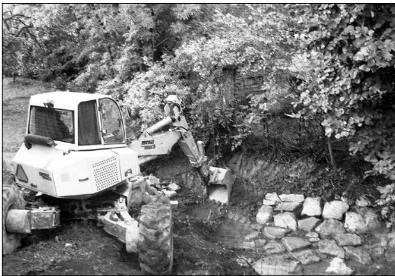
Oprava břehu na Pohoršově u č. 21