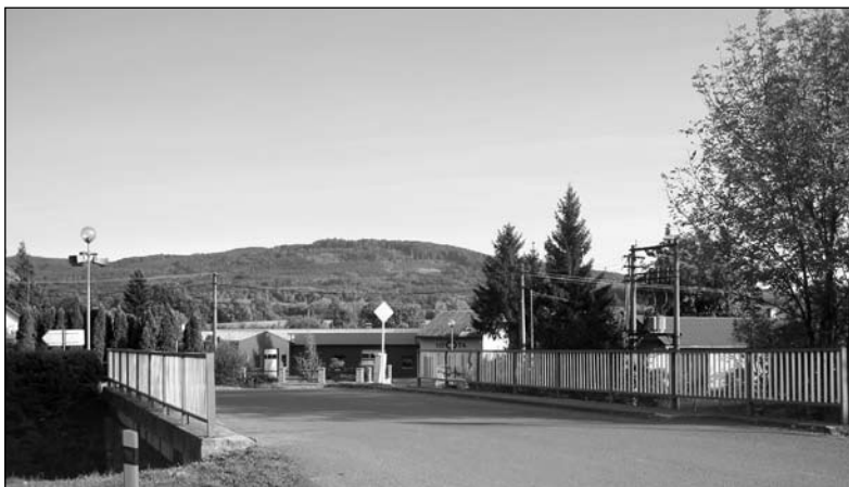
V roce 2012...