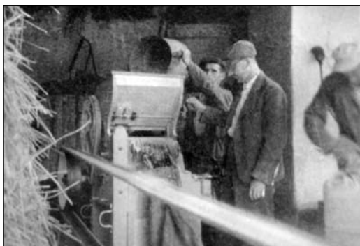
Zemědělci v roce 1944 v čísle 33

do večera ze stodol, stodůlek, mlatývek i z mlatů udusaných na dvorcích rytmický klopot ručního mláčení. To se na mlatu rozprostřelo vždy pár snopů, s klasy otočenými pěkně do středu kruhu. Ten potom obstoupili mlatci – muži, ženy, dospělí i dospívající, nebo výpomocná síla, prostě každý v domácnosti, kdo už stačil vládnout cepem. Umění mlátit zrna, větší než pouze zvedat a nechat dopadat cep na klasy, spočívalo v tom, opakovat to jeden po druhém v přesně dodržovaném pořadí tak, aby na mlat v určitém okamžiku dopadl vždy jen jeden cep, který byl na řadě, jinak by se potloukly navzájem.