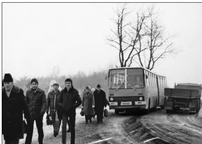
Ranní směna přijíždí z práce - 4. ledna 1985, čas: 15.25 hodin