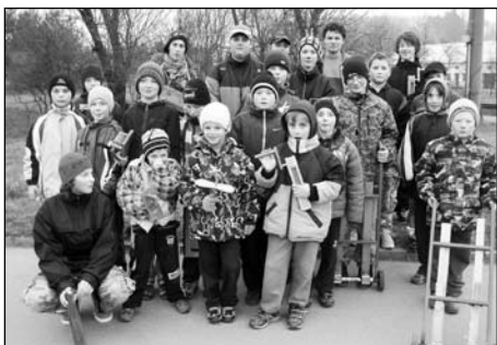
Hrkači 5. dubna 2011

Tradice mají v životě obce své místo i v dnešní době