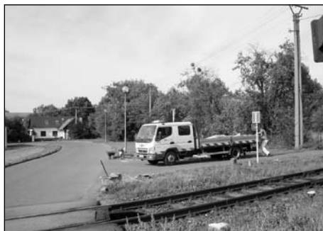
Montáž značek proběhla 17. 9. 2012

Posledních 60 metrů místní komunikace před novostavbami v ulici Na Vinici bylo dokončeno letos v září a komunikace tak dostala finální podobu v celé délce.