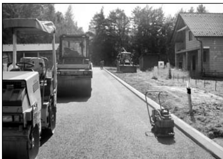
Pokládka živичné směsi dokončena