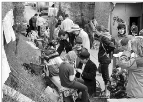
22. 4. 2012 - Jaro v muzeu