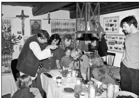
18. 12. 2011 - Adventní neděle v muzeu

po velikonočních svátcích. Myslím si, že i tak to mělo svoje kouzlo. Ve světnici se topilo v kamnech, u kterých byly v košíku malá koťátka, voněl domácí chleba a koláče, v oknech byly krásné rozkvetlé muškáty. Na zahradě se pásly ovce s beranem a jehňátky a kluci z kopečka „váleli sudy“.