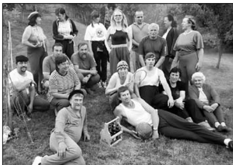
16. 6. 2012 - Táborák v tepláčkách