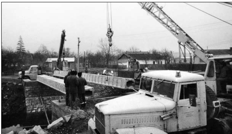
V letech 1982 a 1983 změnila řeka Rusava u hlavní silnice své koryto. Řečiště bylo narovnáno a u vjezdu do obce vyrostl nový most.