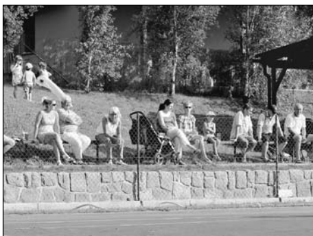
Diváci sledují jedno ze závěrečných utkání