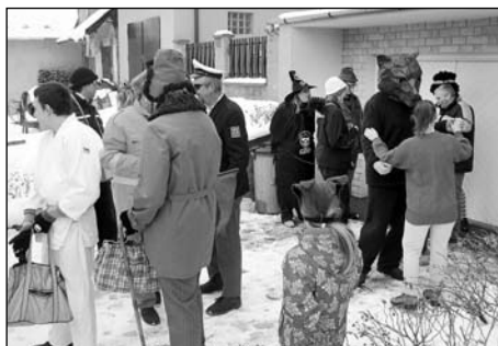
Hasiči stále udržují masopustní zvyky - 18. 2. 2012