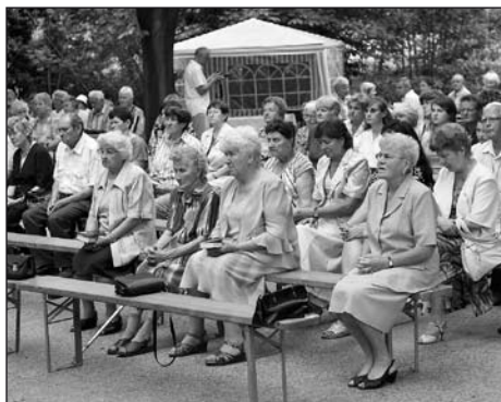
Mše svatá v Hájičku