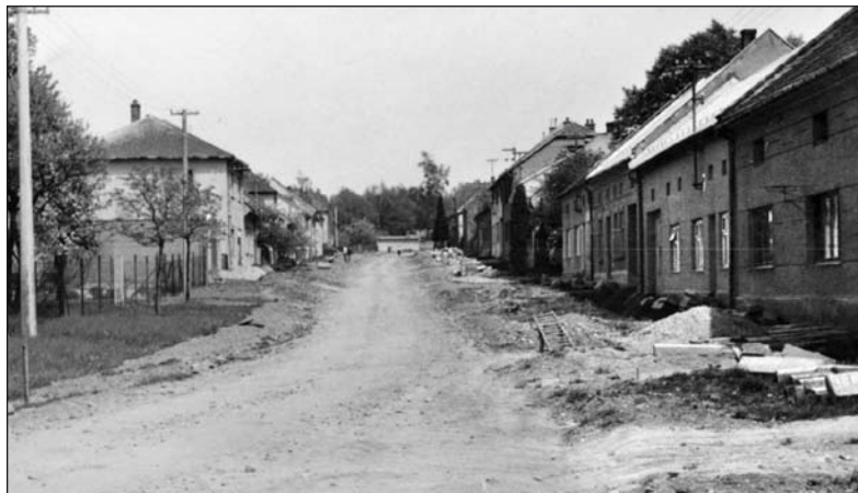
V roce 1979...