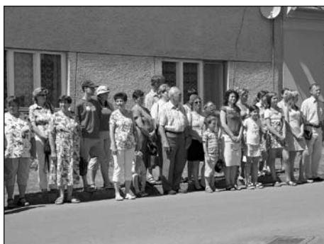
Shromáždění u pomníku padlých