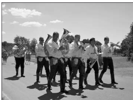
Miločanka ve slavnostním průvodu