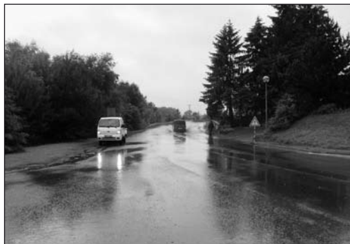
Provoz na hlavní silnici před čp. 74 musel být z důvodů zaplavení omezen