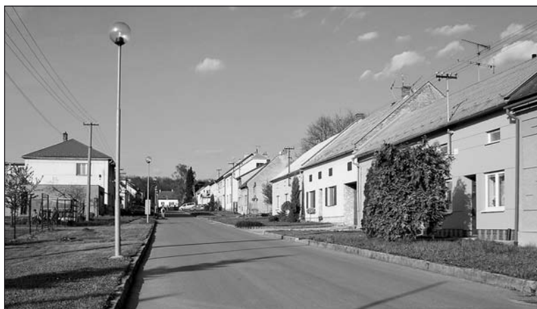
V roce 2009...