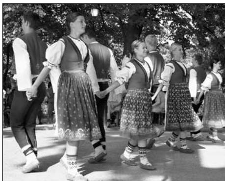
Vystoupení souboru Rusavjan