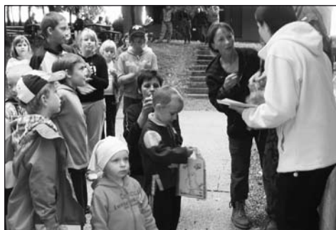
Vyhlášení nejmladší kategorie