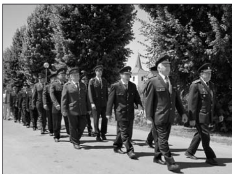
Oslavu podpořili svou účastí také hasiči