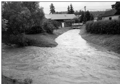
Velká voda zahrozila ve středu 2. června dopoledne