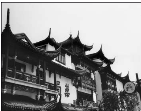
Typická čínská architektura

Takový zájezd se nepochybně trvale zapsal i do vzpomínek Kamilky Zicháčkové. Přejme jí od srdce, aby zážitky, které jí za Velkou zdí potkaly, zúročila nejen ve škole, ale také ve svém dalším životě, kde cesta k úspěchu vede jen a jen přes disciplinovanost, pílí a vůli se prosadit (a je k němu třeba také trocha štěstí a božího požehnání).