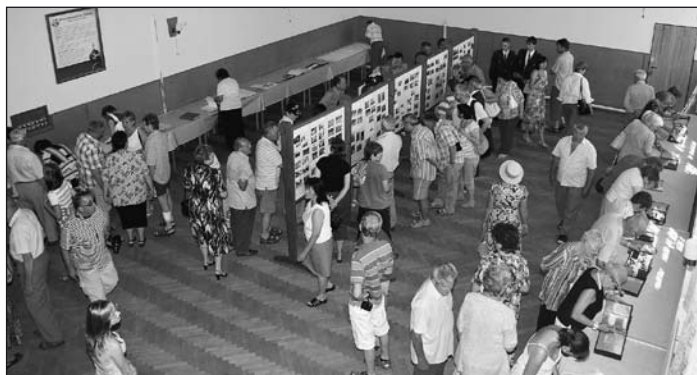
O výstavu fotek a kronik byl velký zájem