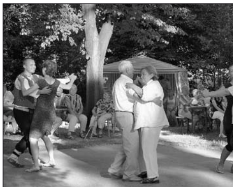
Tanec v rytmu tónů Miločanky