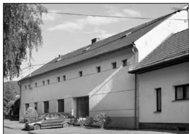
Dům č. 9 v roce 2010