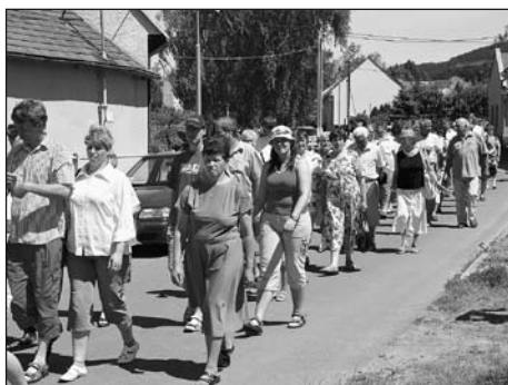
Zástupy občanů a rodáků prochází před číslem 2