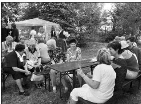
Přišlo na řadu i setkání a vzpomínání