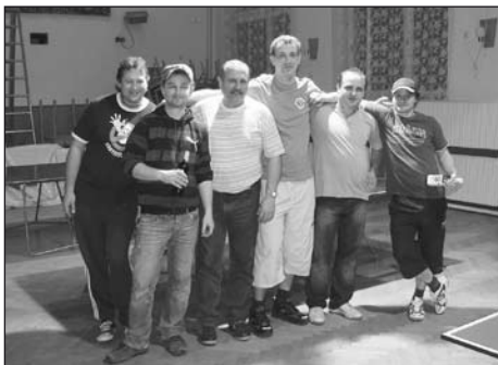
Vyhlášení nejlepších dvojic ze čtyřher mužů