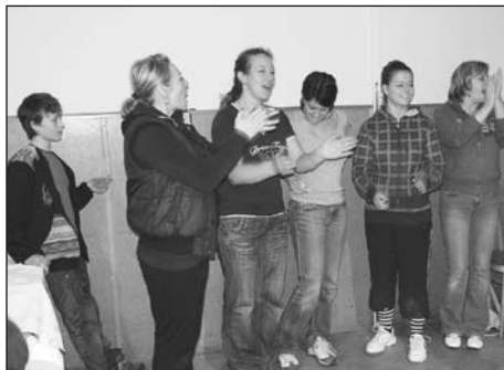
Účastnice kategorie žen