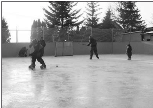
Na ledě bylo plno bruslařů každý den

V odvetném utkání (22. 1. 2010) ženatí drželi krok ve skóre pouze v první třetině, poté už diváci viděli v zápase hraném za desetistupňového mrazu góly jen z hokejek svobodných a na závěr svítilo na pomyslné světelné tabuli 15:4 pro svobodné. V hokejovém utkání se sousedními Dobroticemi, které se odehrálo 12. února, zvítězily Jankovice v poměru 11:5, přestože se jim vůbec nepovedl začátek utkání. Již ve čtvrté minutě prohrávali 0:2. Zápas měl velmi dobrou úroveň a tempo, které bylo přerušeno pouze výpadkem elektrické energie v průběhu 3. třetiny.