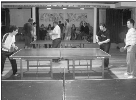
Hrálo se na třech stolech