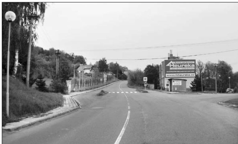
...a v květnu 2010