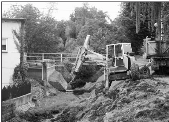
Čištění Zhrty – červenec 2009

Na žádost obce zajistily Lesy ČR správa toků oblast Povádí Moravy vyčištění a opravu horní a dolní části potoku Zhrta. Na této akci se opět podílela firma Natrix Hodonín. Na střední část potoku je zadáno vypracování nového projektu a samotná oprava bude provedena v roce 2010 nebo 2011.