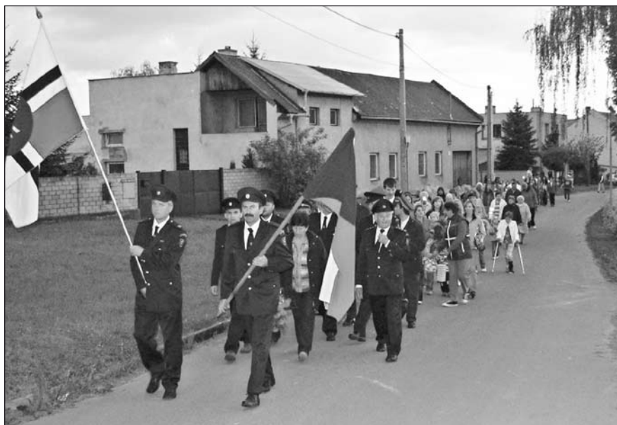
65. výročí od konce 2. světové války