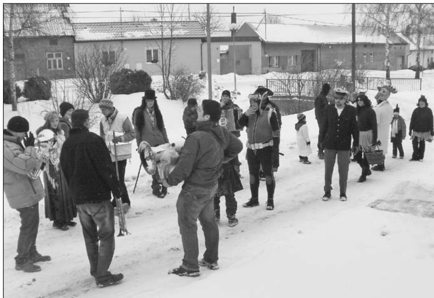
Počtýný masopustní průvod 13. 2. 2010