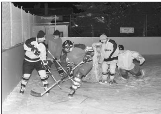
Z utkání svobodní – ženatí 22. 1. 2010

O týden později už nebylo po ledu ani památky. Zůstaly jen vysoké bariéry sněhu kolem kluziště, které vznikly po několika sněhových nadílkách, se kterými si vždy obětaví brigádníci s maximálním úsilím poradili.