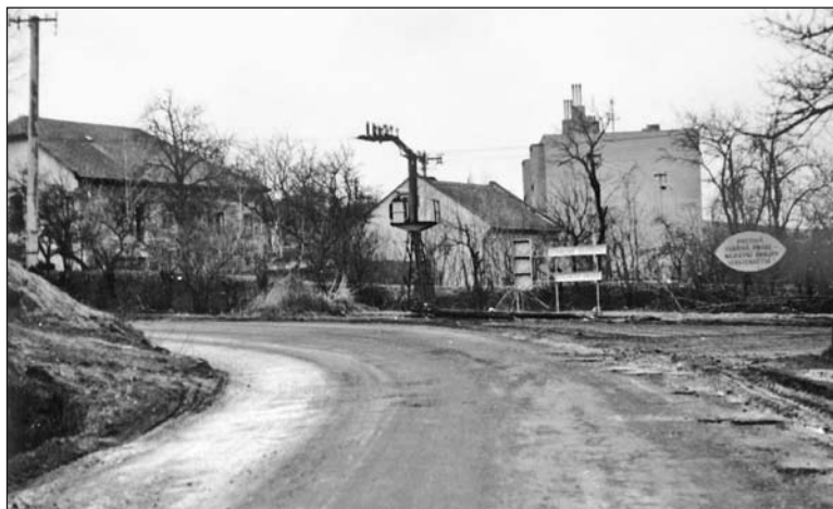
Hlavní silnice ve směru Bystřice pod Hostýnem - podzim 1981