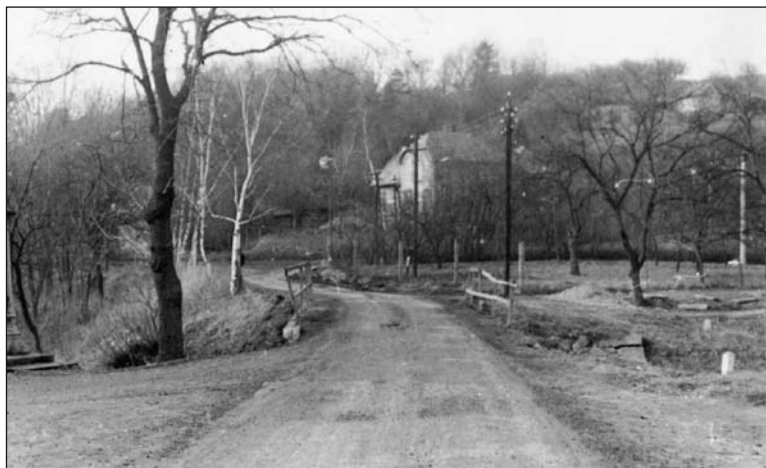
V roce 1979...