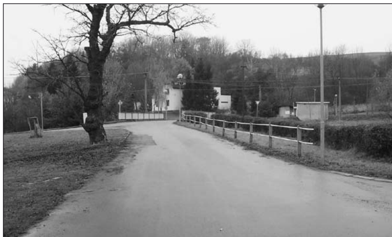
V roce 2009

Vydává: Obec Jankovice Zpracoval: M. Darebník Adresa: Obecní úřad Jankovice 101, 769 01 Holešov e-mail: obec@jankovice.net Internet: http://www.jankovice.net Náklad: 170 ks Tisk: TYPOservis Holešov