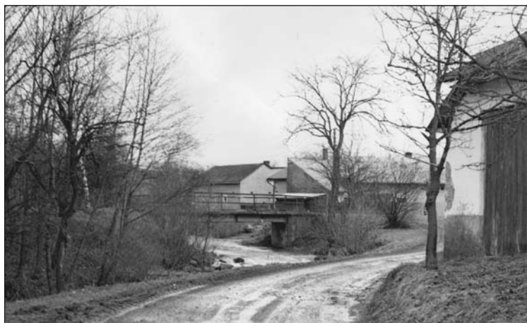
Starý most v roce 1980