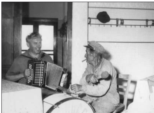
S oblíbenou harmonikou