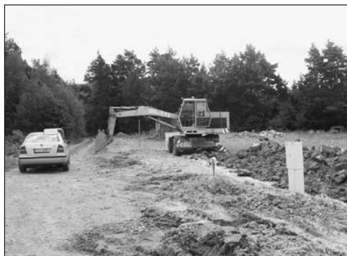
Budování sítí k novým stavebním parcelám

Všem, kteří se na těchto akcích pro obec a občany podíleli, patří velké poděkování.