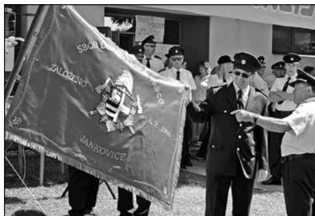
Představení nového praporu SDH Jankovice

Po obědě a krátkém posezení se dění přesunulo do venkovních prostor, kde začala před zbrojnicí v 15 hodin mše, kterou sloužil děkan ho-