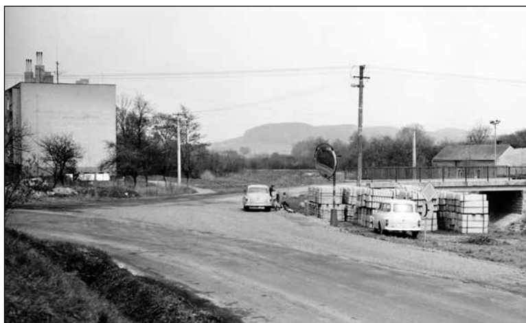
Hlavní silnice a okolí mostu přes Rusavu 25. 4. 1985