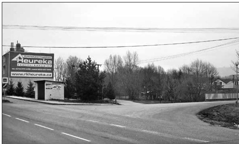
... v roce 2014