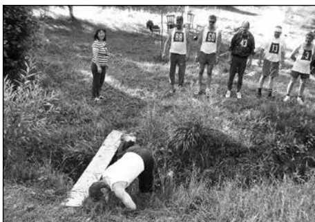
Červnové sportovní odpoledne členů spolku