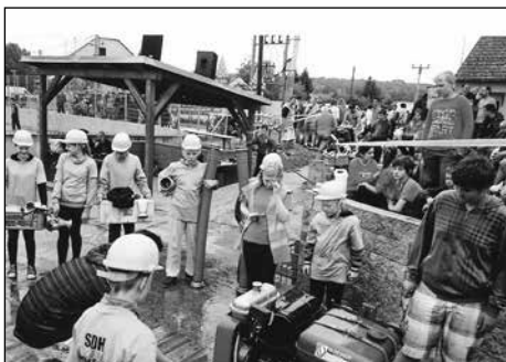
31. 8. 2014 – pohárová soutěž v Míškovicích

pro cvičení požárního útoku nebo trénování na branný závod, či jen tak pro uvolnění, kdy hráme kolektivní a zábavné hry, protože hasič přece není jen o tvrdé práci, ale i o zábavě.