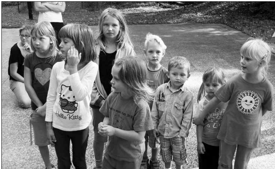
Fotka z archivu