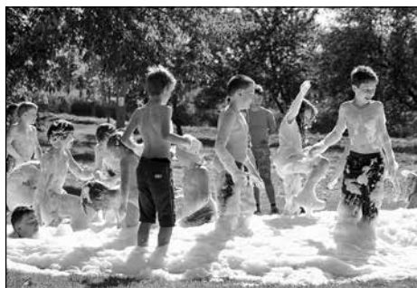
Na závěr odpoledního programu děti dováděly v pěně