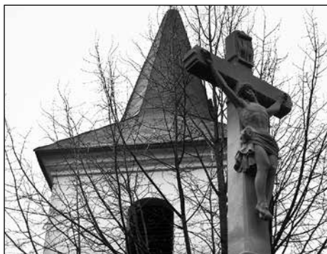
Na konci minulého roku se vrátil po opravě kamenný kříž na své místo

Na jaře 2014 vyrostly na hřišti u OÚ pozinkované stožáry, na které byla zavěšena tkaná síť chránící a oddělující dětské hřiště od fotbalového. Významně se tak zvýšila bezpečnost dětí a jejich doprovodu hrajících si na dětském hřišti. Ochranná síť brání také častému pádu fotbalových