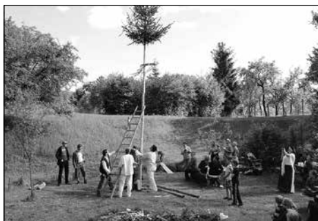
Pohoršovská zahrádka 10. 5. 2014 – stavění máje

Měsíc červen byl ve znamení sportu. Sešli jsme se v sobotu 14. odpoledne v zahradě „muzea“, a se slovy „ve zdravém těle, zdravý duch“ to začalo. Hod čímkoliv, běh do kopce, z kopce, skok přes