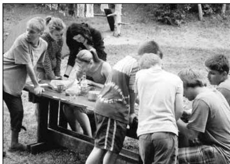
Na mladé hasiče čekala spousta úkolů