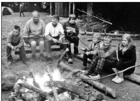
Nechyběl ani táborák