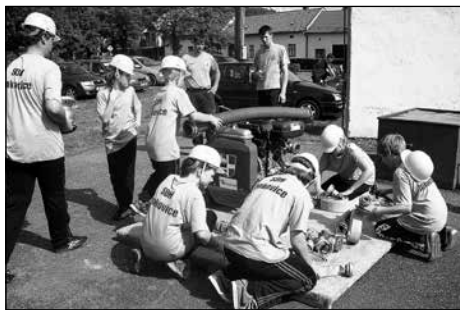
Poprvé se představili 24. 5. 2014 na okrskové soutěži v Brusném

7. června jsme měli další možnost si vyzkoušet požární útok naostro, a to u nás v Jankovicích na oslavách 70. let založení sboru.