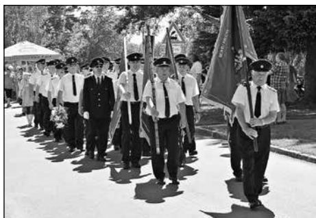
Slavnostní průvod hasičů

Pořízení slavnostního praporu by však ani v dnešní době nebylo možné bez podpory sponzorů, kteří výhradně na tuto věc našemu sboru věnovali finanční prostředky. Byly to: Plaán czech, s.r.o. Kroměříž, Brno Solar Park, a.s. Brno, BM plus, spol. s r.o. Holešov.