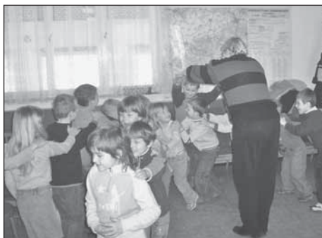
Zábava v plném proudu