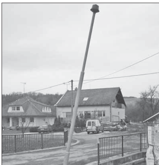
Jízda řidičů v naší obci již poněkolkáté skončila nárazem do sloupu veřejného osvětlení. Nekritičtějším místem v obci je však okolí domu č. 13, kde došlo v minulých letech k nemalým škodám na soukromém majetku majitele.