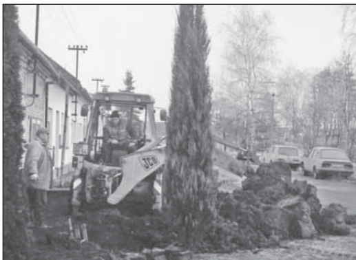
Pracovníci VAK odstraňují poruchu