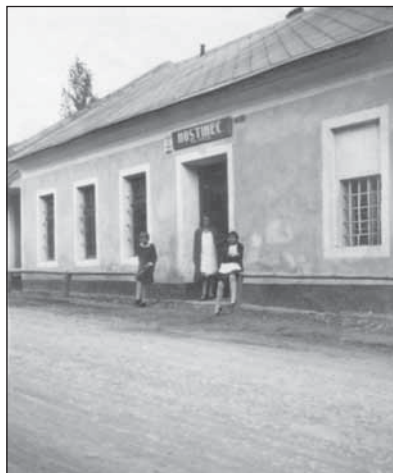
Hospoda Na Valše v Jankovicích

S pádícím časem se měníme nejen my, ale příčinností občanů naší obce i okolí kolem nás. Z očí nám zmizely hospoda na návsi a také hospoda na Valše, která stávala pod Skybou u silnice z Holešova do Bystřice pod Hostýnem. A právě na její dávnější minulost jsem zavzpomínal jednoho dubnového