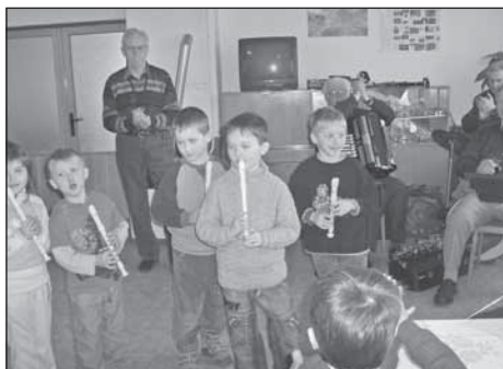
Svoje muzikantské umění předvedly i děti

S několikadenním předstihem si děti z MŠ v Dobroticích, kam chodí i spousta školáčků z Jankovic, připomněly velikonoce. Místní obecní úřad pro ně připravil besídku v naší zasedací místnosti OÚ, kde