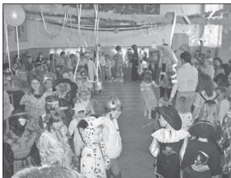
Maškarňí ples >

Tenisový klub ATPS Jankovice Vás zve na tradiční turnaj ve dvouhrách O pohár starostky obce, který se uskuteční od 4. 7. do 8. 7. 2007 na místním tenisovém kurtu.