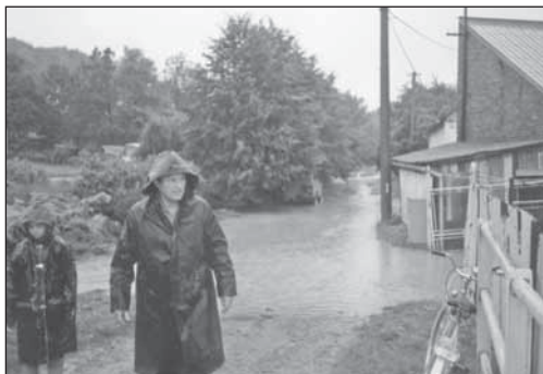
Neděle 6. 7. 1997 16.00 hodin - řeka Rusava začíná přetékat přes koryto, nejhorší okamžiky však mají teprve přijít...