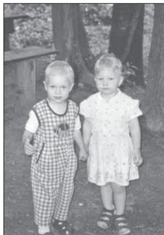
Jedni z mnoha malých návštěvníků dětského koutku.