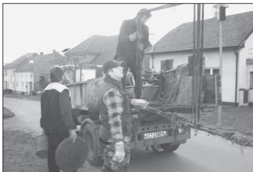
Jarní úklid – hasiči sbírali železný šrot (16. března 2007)