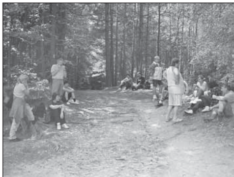
Putování po Českém ráji

V poslední den roku 2006 se všichni sešli, aby se rozloučili se starým rokem a zároveň přivítali