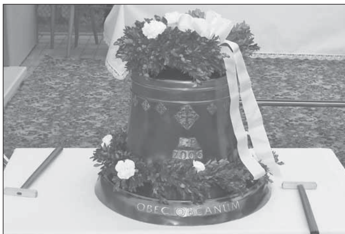
Detail nového zvonu