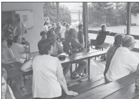
Finálové boje provázel velký zájem diváků