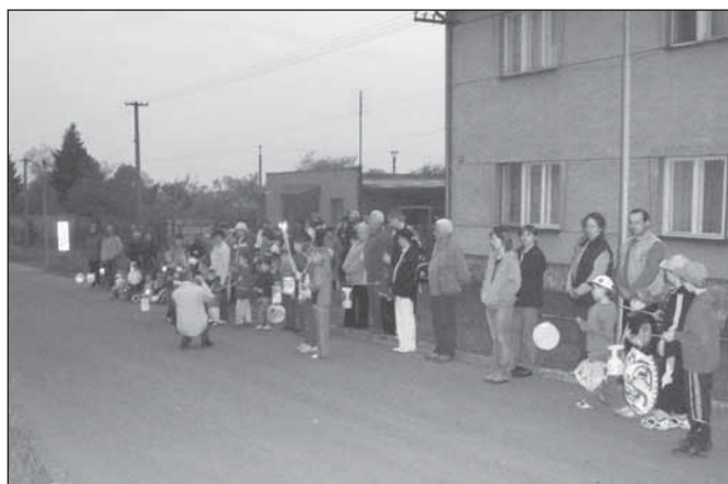
Oslava osvobození obce, lampiónový průvod – květen 2006