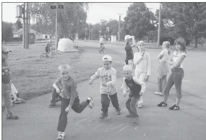
Běžecké závody na konci prázdnin